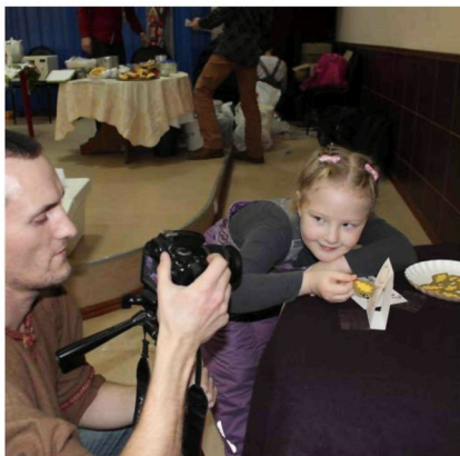
Vačelav Saveljev Petroskoista hekti šyötä hirvi-flesh-mobin, kumpasen osallistujiksi tulutih ravintolapäivän isäntäveiväki ta vierahat. Tulokšena nämämä filmin.

artistoilla, tietoruatajilla, urheilijilla, työmasterioilla. Jokaisella oli oma paikka! Halukkahie oli niin äjän, jotta ei kaikki mahuttu, a paperiohjelmat, kumpaseita oli painettu šatoja, lopottih jo tunnin päästä. Tunnusčien, jotta tapahtuman järjestäjät ei šuunniteltu, jotta tulou niin äjän rahvašta. Ka kuiteski ilmapieri oli hyvä, šentäh kun tapahtumah tuli äjäjän yštävie. Hyvällä mielin ravintolan vierahat otetih vatah Čičilusku-teatterin lyhyön esityšken karjalankielisellä Koirenen Kalevala-spektaklis-ta.