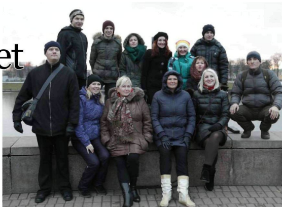
Karjalan karjalaiset ta Moskovan udmurttilaiset tulutih Tverin kaupunkin osallistumah Kyliläni karjalaini hirvi-ravintolaprusnikkeh, kumpaseita tuli tovelini suomalais-ugrilaini festiivali.

Šuuri porukka Petroskoista kävi kačomassa ta syöttämässä Hirvie karjalaiset kyläbloggerit, Čičilusku-kuklatatteri, Karjalan Kansallisen museon ta Periodika-kustantamon matkajat. Matan järjestäjällä oltih tunnetut Sloika-firman perustajat Saveljeven veivot. Heijän avuksii tuli Kansallisen kulttuurien keskuš. Matan sponsorina oli Karjalan kulttuurimäš (Zelotze kol'co Karelii)-turistifirma. Mitein onnistu matka Tverih, kerrottih iše matan järjestäjät, Hirvien syöttäjät.